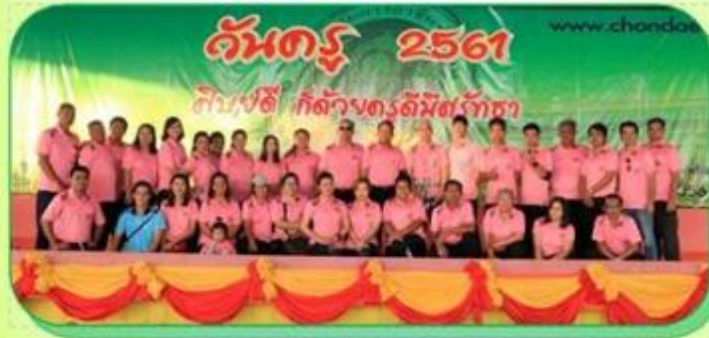
กิจกรรมวันครู 2561 ณ วิทยาลัยการอาชีพชนแดน 16 มกราคม 2561

Chondaen Industrial and Community Education College : CICE