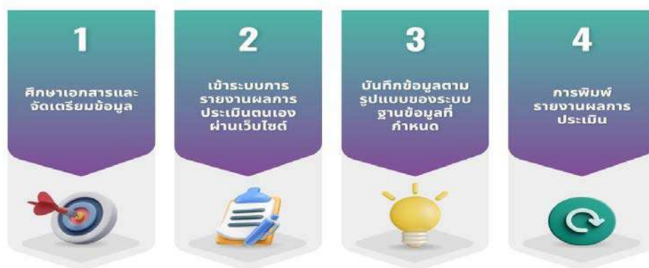
ภาพที่ ๖.๑ การรายงานผลการประเมินตนเองผ่านระบบออนไลน์